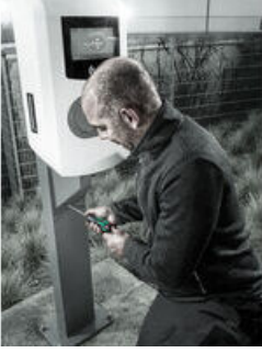
Hızlı ayarlı torklu tornavida

Duyulabilir ve hissedilebilir aşırı yük sinyali