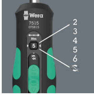
Sınırsız gevşetme ve sıkma torkları için seçilebilir beş sıkma torku (2,0; 3,0; 4,0; 5,0; 6,0 Nm) ve tork kilidiyle sabit konum.