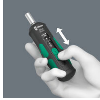
Seçilebilir sıkma torklarının kolay ayarı.