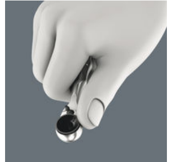
Hızlı vidalama için tırtıklı tekerlek.