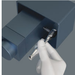
Ulaşılması zor alanlardaki tüm uygulamalar için mini cırcırlar.