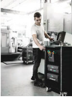
Wera 2go 4 alet çantası