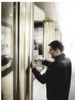
Bits med reducerad skaftdiameter