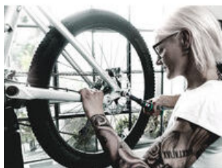
Click-Torque A 6