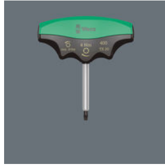
För tillämpningar med oföränderlig, dvs. ej inställbar momentklinga.