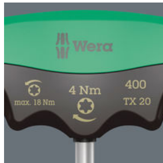
Märkning av greppet med skruvsymbol, storlek och moment samt maximalt lossningsmoment.