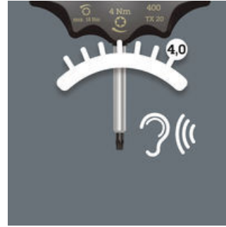
Tydligt hörbar och taktill signal när inställt moment uppnås.