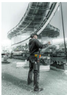
Наборы отвёрток в поясной сумке