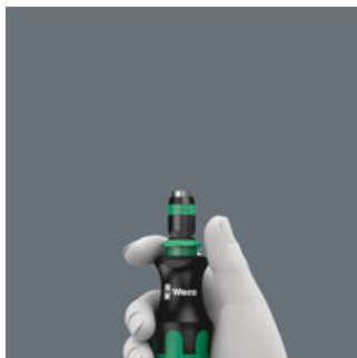
Телескопическая вставка I

Утопленный в ручке выдвижной стержень с быстрозажимным патроном позволяет легко обращаться с инструментом даже в стесненных условиях работы, когда стержень не выдвинут.