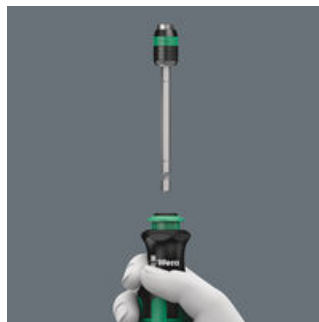
Телескопическая вставка III

Если повторно нажать на гильзу со слышимым и ощутимым преодолением сопротивления стопорного механизма, происходит его разблокировка. Выдвижной стержень можно извлечь и использовать в качестве адаптера в машинном режиме или вернуть в исходное положение.