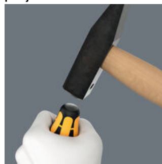
Wkrętak do pobijania wyposażony w nakładkę do pobijania zwiększającą trwałość narzędzia i ograniczającą ryzyko rozszczepienia rękojeści. Należy jednak zawsze przestrzegać podstawowej zasady: nosić okulary ochronne!