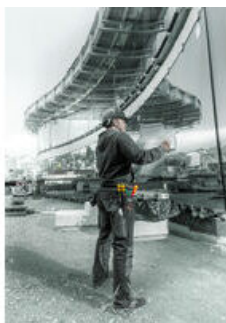
Zestawy wkrętaków w kieszeni na narzędzia do mocowania na pasku