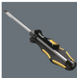
Przelotowy trzpień sześciokątny wkrętaka do pobijania z wysokiej jakości materiału używanego do produkcji bitów wkrętakowych pozwala na bezstratne przenoszenie siły nawet podczas pobijania. Ulepszony cieplnie materiał o dużej ciągliwości zapobiega odpryskom lub pękaniu trzpienia.