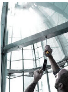
Wbudowany kołpak do pobijania

Często zdarza się, że wkrętak jest używany jako dłuto. To niebezpieczne. Wkrętak do pobijania to rozwiązanie, które pozwala na więcej niż tylko dokręcanie. Zaprojektowany do dokręcania, pobijania, kucia i luzowania mocno dokręconych wkrętów. Wkrętak do pobijania Wera: wkrętak, który nie boi się ciężkiej pracy.