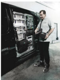
Wera 2go 1 - Narzędzia na zewnątrz