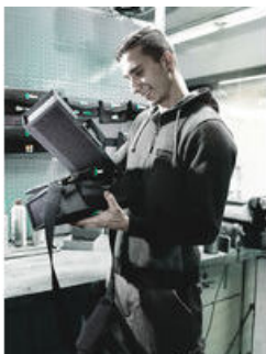
Wera 2go 1 - Narzędzia na zewnątrz