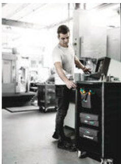
Pojemnik tekstylny na narzędzia Wera 2go 4