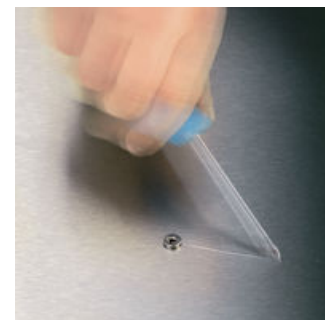
Det hender stadig vekk at verktøypissene glipper ut av skruhodet når man skrur, og noen ganger medfører det skade på dyrebare overflater eller også personskade. Spissene på Wera Lasertip-skrutrekkerne gjøres mikroskopisk ru ved hjelp av laser. Denne ru overflaten "biter" seg bokstavelig talt inn i skruhodet. Utviklede glipp hører dermed fortiden til.