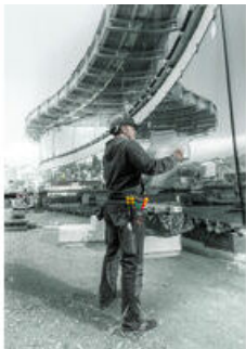
Schroevendraaiersets in riemetui