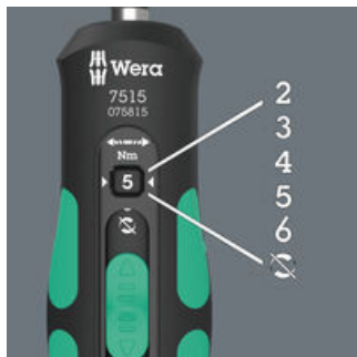
Vijf te kiezen aanhaalmomenten (2,0; 3,0; 4,0; 5,0; 6,0 Nm) en een vaste stand (Torque Lock) voor onbegrensde losdraai- en aanhaalmomenten.