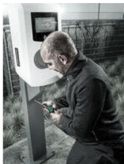
Momentschroevendraaier met snelle instelling van het aandraaimoment