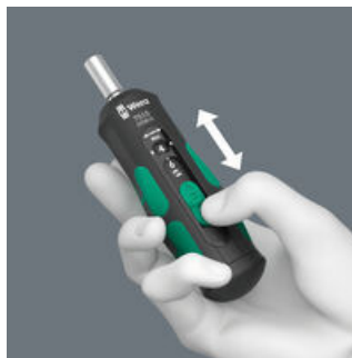
Eenvoudige instelling van de beschikbare aanhaalmomenten.