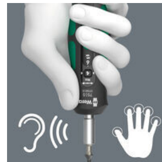
Duidelijk hoor- en voelbaar kliksignaal bij het bereiken van het draaimoment.