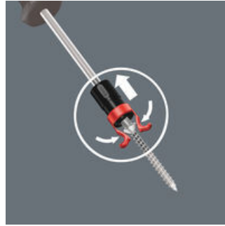
En zo werkt de schroefhouder

Schroefhouder verder in de richting van de greep trekken tot beide armen van de schroefhouder aan de kop van de schroef vast zitten en deze licht zijn gespreid. De Wera-schroefhouder laat de schroef na het schroeven automatisch los!