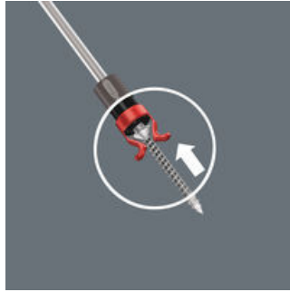
En zo werkt de schroefhouder

Schroef op de punt van de kling in de houder zetten.