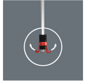
En zo werkt de schroefhouder

De twee grijparmen spreiden zich verder open als ze tegen een oppervlakte worden gedrukt en sluiten zich weer vanzelf als de kop van de schroef is verzonken.