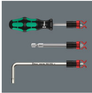
En zo werkt de schroefhouder

De schroefhouder kan ook met inbusleutels en lange bits worden gebruikt!