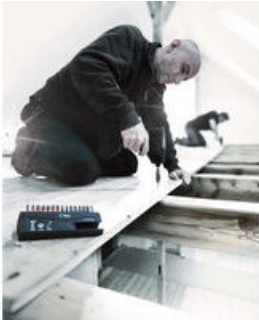
Impaktor houder met ringmagneet

Impaktor-technologie voor een bovengemiddelde gebruiksduur ook onder extreme situaties