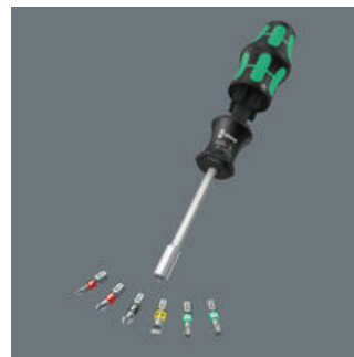
Het handgreep/wisselkling-systeem staat razendsnel wisselen van de kling toe en biedt zo talloze toepassingen.