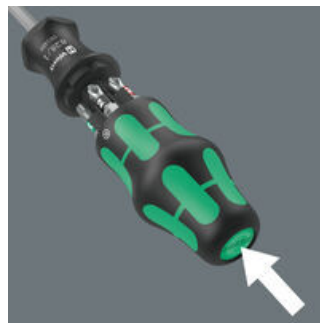
De greep kan met de bedieningsknop worden geopend. In de greep is een magazijn voor 6 bits geïntegreerd.