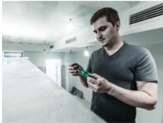
Kraftform Kompakt 27 met zes bits in greep.