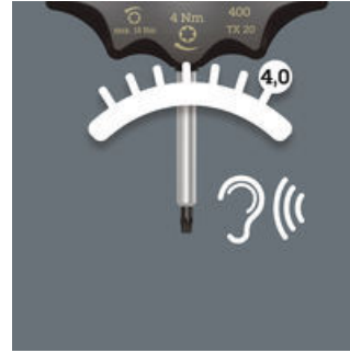
Duidelijk hoor- en voelbaar kliksignaal bij het bereiken van het draaimoment.