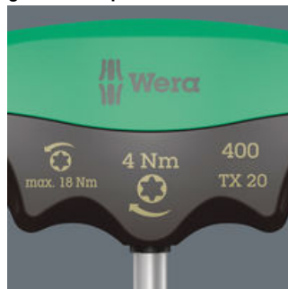
Handgreep gemarkeerd met schroefsymbool, formaat en draaimoment en maximaal losdraaimoment.