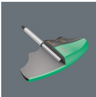
Meercomponenten greep voor het ergonomisch correct schroeven.