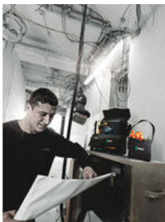
Wera 2go gereedschapsdraagtas