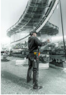
벨트 홀스터에 내장된 스크류드라이버 세트