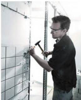
일반적인 나사 작업, 정(끝), 구멍뚫기, 움직이지 않는 나사를 풀어 내는데 사용되는 Wera 정(치즐) 드라이버. 다중 재질의 크라프트폼 손잡이로 빠르고 원활한 작업이 가능하다.