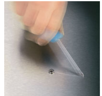
나사 작업 시 종종 팁이 나사 머리에서 미끄러져 표면에 손상이 가거나 부상을 유발합니다. Wera의 레이저팁 기술을 적용하여 스크류드라이버의 팁을 미세하고 거칠게 처리했고, 이 거친 표면은 원심력에 의해 비트가 나사로부터 미끄러져 빠져 나오는 것을 차단합니다.