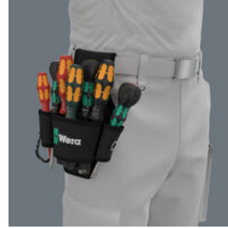
견고한 재질의 벨트 파우치는 벨트에 부착할 수 있다.