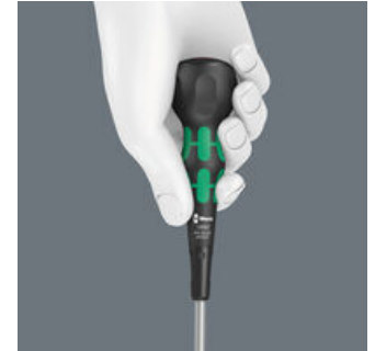
인체공학적으로 설계된 크라프트폼 볼그립은 손에 딱 들어 맞는다. 볼그립의 볼록한 형상으로 인해 높은 토크를 전달할 수 있다.