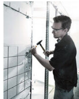
일반적인 나사 작업, 정(끌), 구멍뚫기, 움직이지 않는 나사를 풀어 내는데 사용되는 Wera 정(치즐) 드라이버. 다중 재질의 크라프트폼 손잡이로 빠르고 원활한 작업이 가능하다.