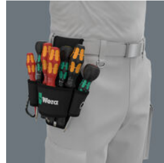
견고한 재질의 벨트 파우치는 벨트에 부착할 수 있다.