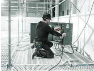
벨트 홀스터에 내장된 스크류드라이버 세트