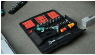
クラフトフォームコンパクト W 1 メンテナンス用