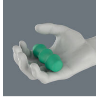
クラフトフォーム

手の形に沿って、ハンドルのデザインを決めるのは、クラフトフォームハンドルのプロトタイプの基本的な考え方です。1960年代には、Weraは国際的に有名なフラウンホーファー研究所と連携して、手の形に合うドライバーハンドルの開発に取り組みました。長い開発期間の末、Weraは1968年にクラフトフォームハンドルを導入しました。それ以来、新しいテクノロジーによってクラフトフォームハンドルは更新されていますが、形状は開発当時のままです。何故なら人間の手の形は不変だからです。