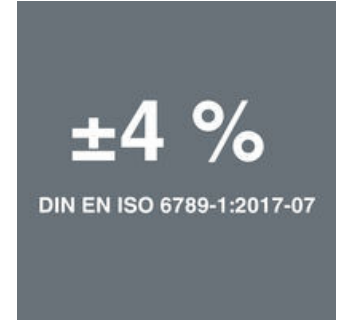
クリークトルクレンチA 6

クリークトルクレンチを開発した主な理由は、トルクレンチを簡単かつ正確に使用できるようにするためでした。デフォルト値の設定やそれをセーブする機能、ヴェラ独自の強固なデザインにより、このシリーズのトルクレンチは、トルク制御の締め付け（時計回りのトルクレンチ）でも緩め（オープントルクレンチ）でもすべてのボルトを用いた作業に最適です。