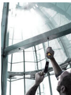
一体式インパクトキャップ

通常のドライバーをタガネとして使用するのは非常に危険です。ヴェラの貫通ドライバーはネジ締め作業だけでなく、ハンドルの後部をハンマーで叩きタガネとして使用することが可能です。ヴェラの貫通ドライバーは過酷な作業にも耐えられるタフなドライバーです。