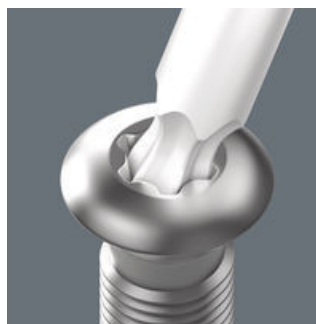
トルクスボールエンド

ボールエンドにより、軸を ネジ中心に回転できます。 角度をつけて作業もでき るため入り組んだスペース にも最適です。