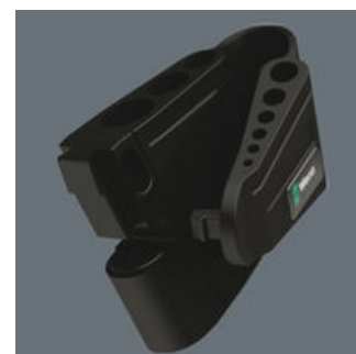
しっかりと取り付け、簡単 に取り外し

L型レンチは耐摩耗性のあ る専用のホルダーに収納 されていて、しっかりと固 定されつつも、取り出し やすい造りになっています。