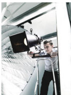
L型いじり止めトルクスレ ンチ