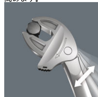
Joker 6004: ラチェット構造により作業スピードを高めます。

Joker 6004の平行で滑らかな開口部は、その表面圧力により、トルクを伝達する時に摩擦によるナットとボルトのエッジの変形を防ぐことができます。