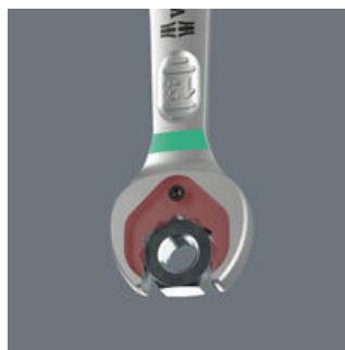
メガネラチェットスパナ Joker 6000

ジョーカーの保持機能により、ボルトとナットをスパナ側で保持でき、狭いスペースでの作業を可能にします。開口部にある取替可の金属プレートがボルトやナットを支え、作業中なくす心配がありません。ボルトやナットの位置が取れたら、他に工具を使わずに直ちにネジ締めを始められます。