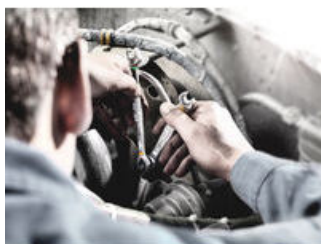
ジョーカー両口レンチ

ラチェットには80本の細かい歯が組み込まれており、狭いスペースでも作業しやすいです。