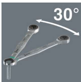
作業角度が小さい

狭いスペースで、ボルトやナットを締めたり緩めたりするには、一般の回転角60°で裏返ししながら作業する必要があります。ジョーカーの特別なダブルヘックスデザインにより、回転角が30度になり、裏返す必要がなくなります。ジョーカーは、一般のスパナレンチが利用できない狭いスペースで重宝されます。リミットストップは錆びたボルトに食いつくこともできます。