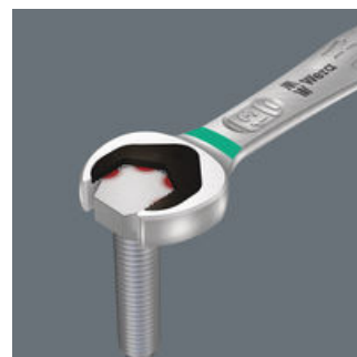
リミットストップ

作業中レンチを裏返しなくしてはいませんか？ボルトを落とさずに保持するのは難しいですか？なぜボルトから滑り出して怪我をしてしまうのか。なぜ指でボルトをおさえなければならないのか。ジョーカーはこれらの問題を解決します。