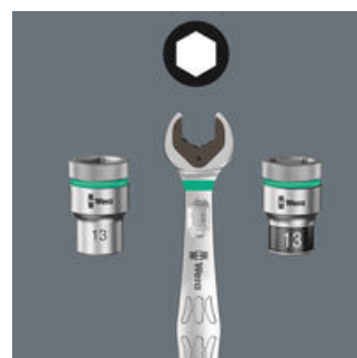
Take it easy 色分けシステム

Take it easy 色分けシステム - 形状とサイズによって色分けされており、必要な工具を見分けやすい。対応の工具：六角ヘックスネジ用 (L型レンチ、サイクロップビットソケット)、六角ネジとナット用 (ジョーカーレンチ、ホールドファンクション付きサイクロップソケット)、トルクスネジ用 (L型レンチ、サイクロップビットソケット)。