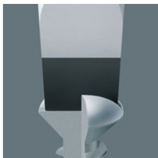
ヴェラ ブラックポイント仕上げ

洗練された硬化処理のヴェラブラックポイント刃先の仕上げは、ネジを保持するほどネジ頭の溝にフィットし、耐食性が高く、耐久年数も長いです。