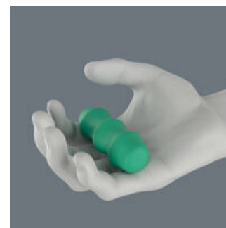
クラフトフォーム

手の形に沿って、ハンドルのデザインを決めるのは、クラフトフォームハンドルプロトタイプの基本な考え方です。1960年代には、Weraは国際的に有名なフラウンホーファー研究所と連携して、手の形に合うドライバーハンドルの開発に取り組みました。長い開発期間の末、Weraは1968年にクラフトフォームハンドルを導入しました。それ以来、新しいテクノロジーによってクラフトフォームハンドルは更新されていますが、形状は開発当時のままです。何故なら人間の手の形は不変だからです。