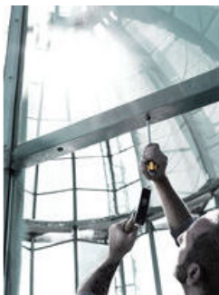
一体式インパクトキャップ

通常のドライバーをタガネとして使用するのは非常に危険です。ヴェラの貫通ドライバーはネジ締め作業だけでなく、ハンドルの後部をハンマーで叩きタガネとして使用することが可能です。ヴェラの貫通ドライバーは過酷な作業にも耐えられるタフなドライバーです。