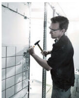
Il giravite scalpello della Wera; per avvitare, scalpellare, far leva e rimuovere viti grippate. Con impugnatura multicomponente Kraftform per lavorare velocemente e in modo poco affaticante.