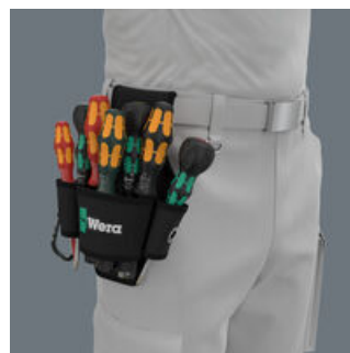
La custodia da cintura in robusto materiale, può essere fissata alla cintura.