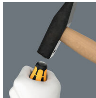
Il giravite scalpello è dotato di cappuccio antiurto integrato per aumentare la durata e ridurre il rischio di scheggiatura. Tuttavia vale sempre: indossare occhiali di protezione!