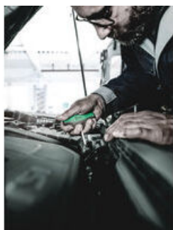
Giravite con impugnatura a "T"