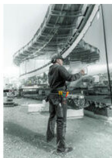
Jeux de tournevis dans la trousse de ceinture