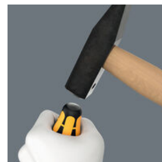
Le tournevis-burin est équipé d'une zone de frappe pour une longévité accrue et une diminution du risque d'éclats. Le port de lunettes de protection reste toutefois un impératif !