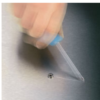
Riper hors de la vis est chose courante lors du vissage. Il arrive même que l'on endommage au passage des surfaces coûteuses, voire que l'on se blesse. La pointe des tournevis Wera Lasertip fait l'objet d'une découpe striée microscopique par rayon laser. Cette surface rugueuse vient littéralement "mordre" dans la tête de vis. Fini les dérapages intempestifs !