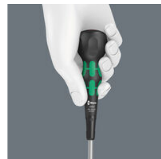
Le manche ergonomique Kraftform Ball-Grip offre une excellente prise en main. Sa forme bombée permet la transmission de couples élevés lors du vissage.