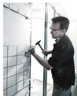
Le tournevis-burin Wera pour visser, buriner, mortaiser et desserrer les vis bloquées. Avec manche Kraftform multicomposant pour un travail rapide et en douceur.