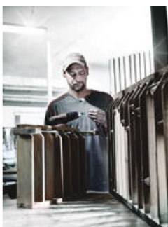
Les embouts BTZ