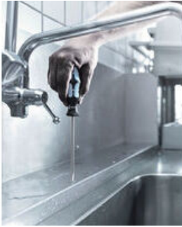
L'inox se visse avec de l'inox !