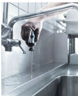
L'inox se visse avec de l'inox !