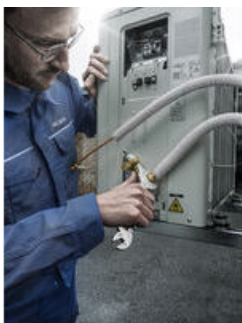
L'atelier de vissage "de poche"