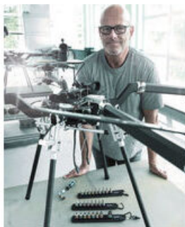
Les sangles porte-outils Wera