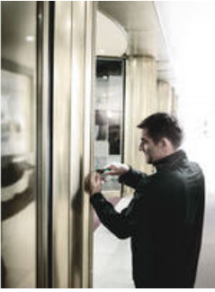
Bits-kärjet kavennetulla varrella