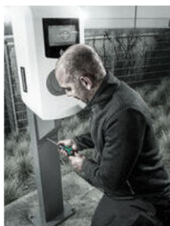
Momenttiruuvitaltta nopealla momentin asetuksella