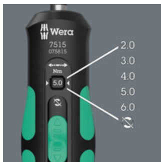
Viisi valittavissa olevaa kiristysmomenttia (2,0, 3,0, 4,0, 5,0 ja 6,0 Nm) ja pois kytkettävä momentinrajoitus (Torque Lock) rajoittamattomia irrotus- ja kiristysmomenteja varten.