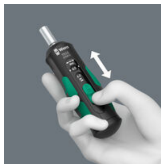
Valittavissa olevien kiristysmomenttien helppo asetus.