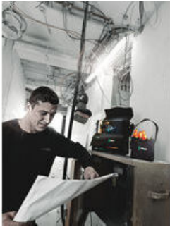
Wera 2go 4 -työkaluviini