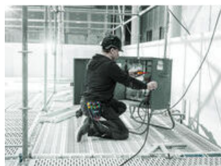
Juegos de destornilladores en una bolsa para el cinturón