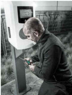
Destornillador dinamométrico con un ajuste rápido del valor dinamométrico