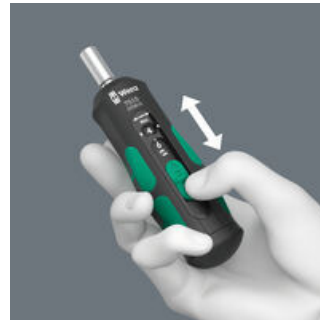
Un ajuste fácil de los pares de apriete elegibles.