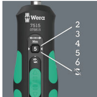
Cinco pares de apriete elegibles (2,0; 3,0; 4,0; 5,0; 6,0 Nm) y una posición fija (Torque Lock) para unos pares de desapriete y apriete ilimitados.