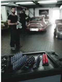
Las "Belts" de Wera