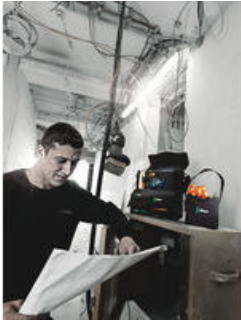
Cestillo Wera 2go 4