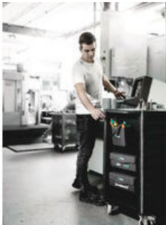
Cestillo Wera 2go 4

Para el puesto de trabajo y durante aplicaciones móviles