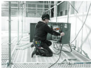
Schraubendrehersätze in Gürteltasche